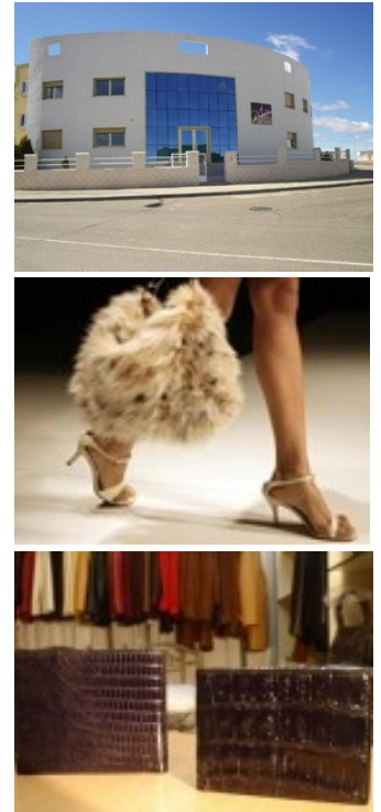
De arriba abajo: Nueva instalaciones de "BY IMELDA" y alguno de sus productos.

Mas: Imelda Sánchez . Calle Tercera 19. Carbajosa de la Sagrada .Salamanca 37188 . Tel 9 2 3 2 0 8 2 2 5 www.byimelda.com