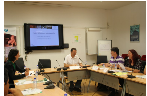
Desarrollo de la conferencia " RETOS DEL SECTOR ARTESANO ESPAÑOL " en la sede del IFES en Madrid

Con el título " RETOS DEL SECTOR ARTESANO ESPAÑOL ", el director de CEARCAL abordó los problemas a los que tiene que enfrentarse la artesanía española, y que según desarrolló en la charla, implican la necesaria puesta en marcha de medidas entre todos los participantes del sector, los Talleres de Arte, las Administraciones y las Organizaciones Profesionales, con el fin de adecuarse a la realidad tecnológica, comercial y social, que nada tiene que ver con la realidad española de hace 30 años, momento en el que aparecieron las primeras normativas autonómicas que regulan el sector, o cuando se configuraron las primeras asociaciones profesionales de artesanos.